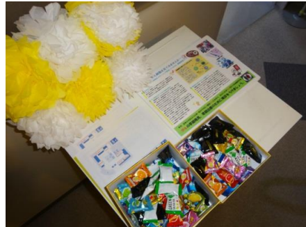
入口には、パンフレットと飴。 今年も、飴でお客さんをお呼び寄せます。