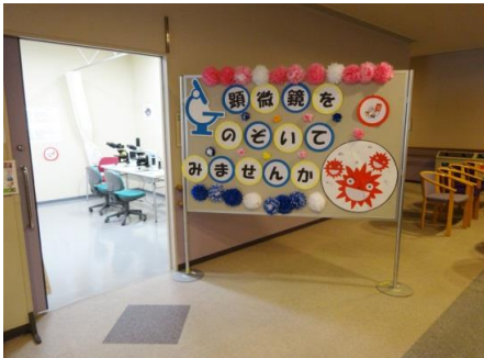
とても可愛い表看板ができました。 今年は入口から、”カ”はってます！！

昨年に加えて子宮癌の顕微鏡像とポスター説明を行うことで、内容がさらに充実し高評価を得られたように思います。また、癌の早期発見・早期治療のために健診を受けて頂けるように、スタッフが一丸となり呼びかけを行いました。