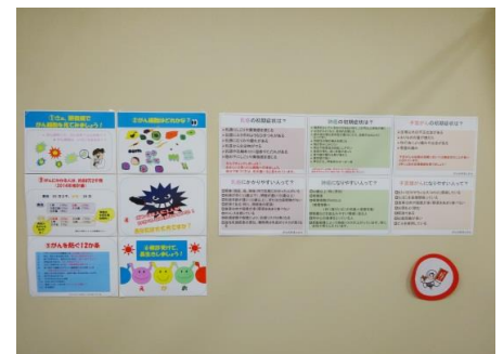
各種癌のリスク因子を展示しました。