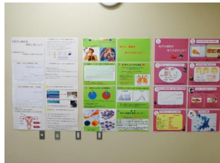
ポスターは、子宮癌、肺癌、乳癌について 展示しました。一般の方に分かりやすい ように、要点をまとめて説明しました。