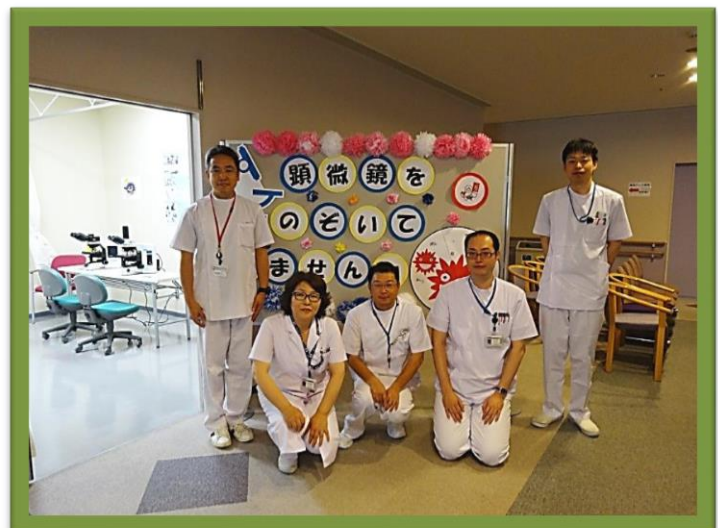
スタッフ一同、楽しく参加して参りました。(##^^#)