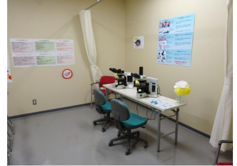
顕微鏡展示は、子宮頸部の扁平上皮癌と、 喀痰の小細胞癌です。