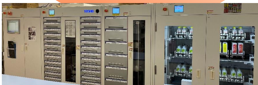
▲ アンブルピッカー

◀ MDMは一包化された薬剤の内容を自動的にチェックする機械で、問題箇所のみ知らせくれる仕組みです。そのため、薬剤師の検閲業務の負担軽減と、調剤過誤リスクの低減に寄与しています。