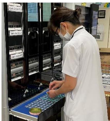
▲ 一包化業務の補助

薬剤部の業務は多岐にわたります。特に薬剤師は患者さんとの関わりがとても重要だと感じています。そのため、我々ファーマクルーが様々な業務をサポートすることで、薬剤部として当院の医療の質向上につながると自負しています。