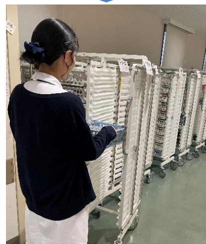
▲ 注射薬カートにセット