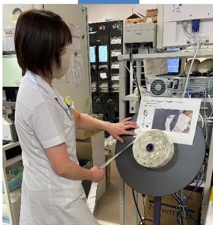
▲ 錠剤一包化鑑査支援システムの補助