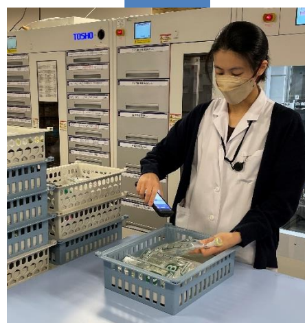
▲ 最終鑑査支援システム（F-AUDIT）で照合

抗がん剤調整補助 在庫管理 外来化学療法受け付け ミキシングルーム内での補助 医療用アプリの補助 資料作成・統計業務